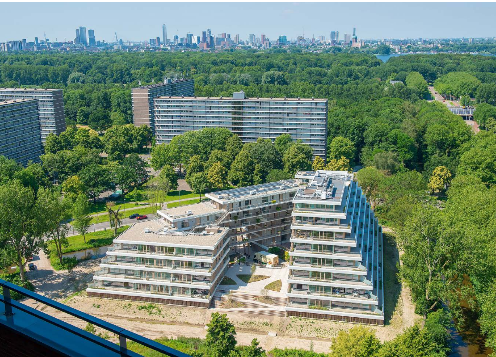
Woongebouw Prinsenpark is ontworpen als een stapeling van terrassen, die geaccentueerd worden door de horizontale witte gevelbanden.

Tekst | Lieke Bousema